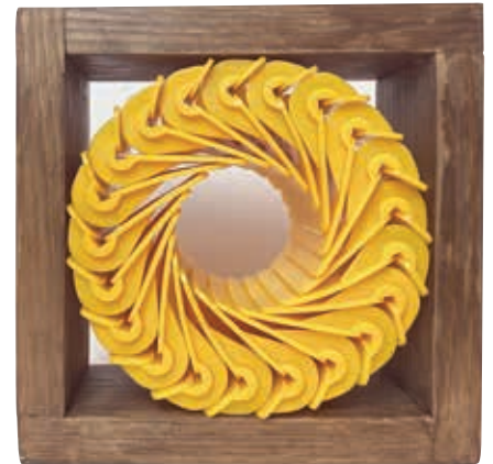
Hamsterrad | @DAN Novak