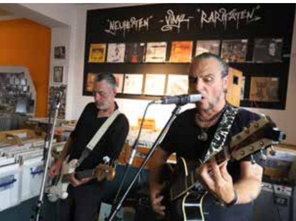
BANKERT UND KAFRUSE

Eröffnet wurde das musikalische Leben am Jazz and Joy Samstag auf dem Schlossplatz durch das BALKAN FUEGO TRIO. Ganz im Zeichen des titelgebenden Balkans fiel es einem nicht schwer, sich bei geschlossenen Augen auf einem Markt irgendwo zwischen Orient und Okzident zu wähen. Doch spätestens, wenn einmal mehr die Glocken von Worms Jazz and Joy bereicherten, wähte man sich wieder in der Nibelun-