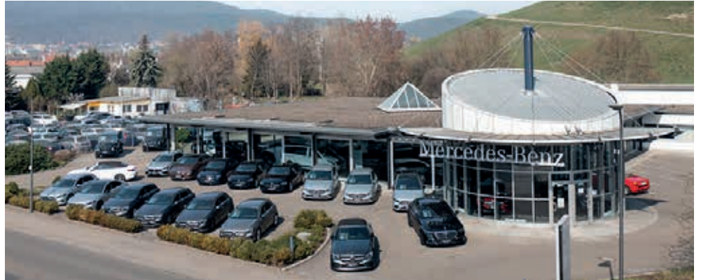
In Neustadt ist ein ganz neuer Standort in Planung, hier noch der aktuelle Standort in der Branchweilerhofstraße.

Die Kestenholz-Gruppe, ein familiengeführtes Schweizer Unternehmen, fusioniert zum 20. August 2024 sieben Standorte in Deutschland und integriert sie vollständig in die Unternehmensstruktur. Die Betriebe in Neustadt an der Weinstraße, Worms, Bad Dürkheim, Grünstadt, Hockenheim, Schwetzingen und Wiesloch waren ehemals der Falter-Gruppe zugehörig.