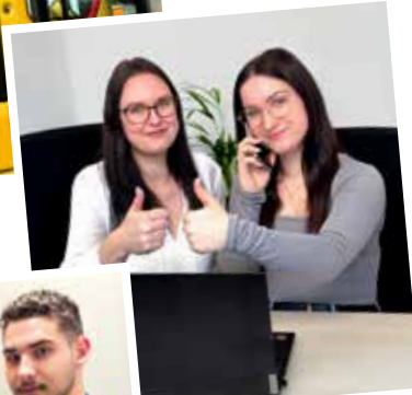
Kaufleute für Büromanagement