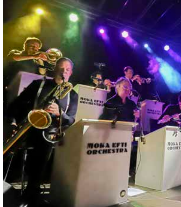
MOKA EFTI ORCHESTRA

irgendwo zwischen Synthesizer und Theremin beheimatet ist) erschuf die Musikerin komplexe Modern-Jazz-Welten. Verschachtelte Melodien und wabernde Tonflächen liefen ineinander und türmten sich immer wieder zu faszinierenden Klangkaskaden hoch. Dabei blieb der Bass stets dominant und gab die Richtung vor, die mal sphärischen Pfaden folgte oder auch mal dem Funk Platz einräumte. Sicherlich keine leichte Kost an diesem frühen Freitagabend, dennoch ein faszinierender musikalischer Kosmos, den Kinga Glyk auf dem Schlossplatz entstehen ließen. Der Weckerlingplatz hatte sich zwischenzeitlich bestens gefüllt. Sitzplätze waren längst Mangelware, als die Band KLANK ein gefeiertes Revival beging. Gegründet wurde die Band vor 52 Jahren im benachbarten Lampertheim als experimentelles Projekt von dem Musiker Hans Heer (Bass). Im Laufe der Jahrzehnte wechselten die Mitstreiter und der Sound wurde von Jazzrock Richtung Funk Fusion erweitert. Weltweit spielte die Band zahlreiche Konzerte, u.a. als Vorgruppe von Rory Gallagher und Meat Loaf. Nun spielten die Musiker erstmals nach vielen Jahren wieder in ihrer Heimat. Nach einem Konzert in Lampertheim folgte nun der Auftritt sozusagen als Vorgruppe vom MOKA EFTI ORCHESTRA. Auf dem Programm stand fiebriger Jazzfunk, immer wieder geprägt vom kraftvollen Saxofonspiel und Heers funky Bass. Nach dem ge-