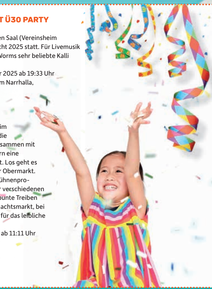
Zusammengestellt von: Roger Kegel, Fotos: parinya agsarattananont, Tjeerd (Hintergrund); adobestock.com