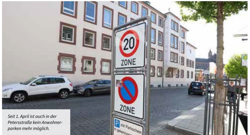
Seit 1. April ist auch in der Petersstraße kein Anwohnerparken mehr möglich.

Stimmung unter vielen Bürgern ist dementsprechend gereizt und der Tonfall gegenüber der Stadt mitunter schroff.