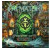
Text: Frank Fischer

CREMATORY veröffentlicht am 15. Mai 2026 das umfassende Greatest-Hits-Album „English Hymns & Deutsche Hymnen“. Die Retrospektive erscheint als 3-CD-Digipak und 2x2LP Vinyl, inklusive neuer Videosingles wie „Born“ und „Blind“. Sie feiert 35 Jahre Bandgeschichte mit den besten Songs der Gothic-Metal-Pioniere, darunter Klassiker wie „Tears Of Time“, „The Fallen“ und „Shadows Of Mine“.