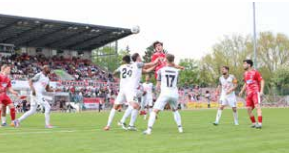
Der überragende Laurenz Graf steigt hoch zum Kopfball.