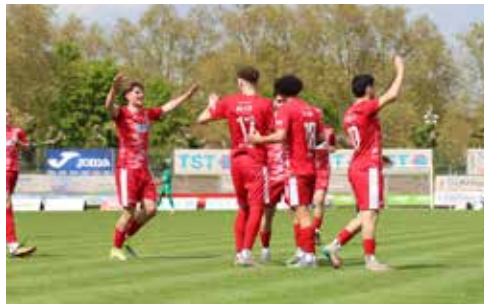
Torjubel im Wormatia Stadion gab es zuvor selten. Gegen Ludwigshafen klingelte es fünf Mal im Tor der Gäste.

Text: Frank Fischer, Fotos: Andreas Stumpf